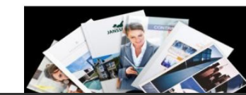
UniCover Wrapped, Mono, Duo & Panorama